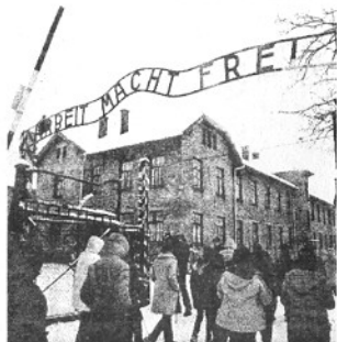
L'ingresso di Auschwitz

Attenzione al trabocchetto della prossima domanda. Gandhi è ancor oggi ricordato per la sua lotta per