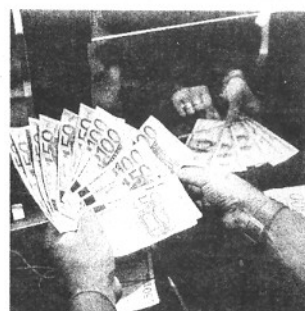
Pronta cassa: cos'è?