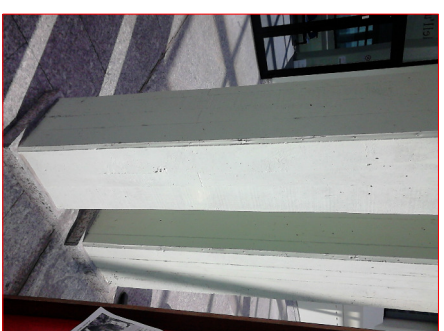
DETTAGLIO PIASTRINI DOPPI

NOTE GENERALI -LAVORI ARTISTICI POTRANNO ESSERE ESEGUITI IN ALTEZZA TRAMITE PONTEGGIO DA INSTALLARSI SECONDO LE REGOLE DEL DLGS 81/08 E S.M.I.; -PROGETTI CHE PREVEDONO L'USO DI MATERIALI AGGRESSIVI O POTENZIALMENTE DANNOSI PER LA MATERIA CHE COSTITUISCE IL PIASTRO DI CEMENTO ARMATO NON POTRANNO ESSERE POSTI IN OPERA; -PROGETTI CHE PREVEDONO LA REALIZZAZIONE DI FORI E PERFORI, TAGLI DI OGNI GENERE SUL PIASTRO NON POTRANNO ESSERE POSTI IN OPERA; -UTILIZZO DI TUTTI I PRODOTTI CHIMICI DEVE ESSERE PREVENTIVAMENTE AUTORIZZATA PER SCRITTO DAL PERSONALE TECNICO COMPETENTE DELL'ATENEO; -LE OPERE D'ARTE, QUINDI, DEVONO INSERIRSI ANCHE NEL CONTESTO NORMATIVO DEGLI EDIFICI PUBBLICI, PER CUI OGNI PROGETTO DEVE ESSERE ACCOMPAGNATO DA UNA RELAZIONE DESCRITTIVA CIRCA LE MODALITÀ ESECUTIVE E DEI PRODOTTI UTILIZZATI DOCUMENTANDO CON LE SCHEDE TECNICHE E DI SICUREZZA