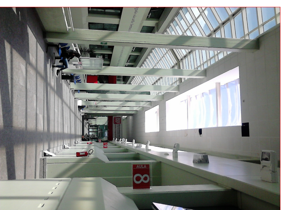
CONTESTO DALL'INTERNO DEL PIANO AULE