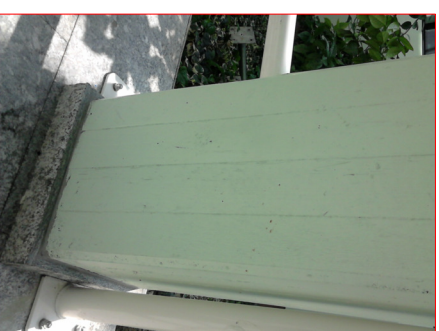
DETTAGLIO PIASTRO SINGOLO